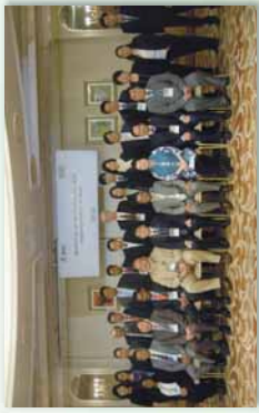
環境省大臣官邸と各国政府関係者

JCM公開セミナーにおいては、JCMパートナー国のうち、インドネシア・ベトナム・タイの担当官が、各国における制度の進捗状況並びにプロジェクト実施等の最新情報について報告しました。また、環境省JCM資金支援設備補助事業を実施する事業者4社(株式会社前川製作所、株式会社ローソン、JFEエンジニアリング株式会社、裕洋計装株式会社)より、プロジェクトの進捗・成果が紹介されました。