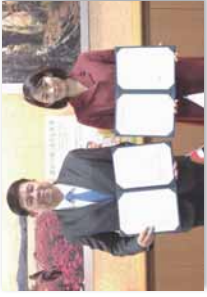
東京での署名の様子

環境省は、民間企業等を対象に案件を公募し、タイに係る案件としては、設備補助事業を7件、案件組成事業(PS)を2件、実現可能性調査(FS)を1件、都市間連携案件形成可能性調査事業2件を採択しました。今後、各案件を確実に実施することで、世界規模でのCO 2 排出削減と優れた低炭素技術の海外展開を具体化するとともに、JCMクレジットの獲得を目指します。