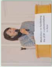
丸川環境大臣によるスピーチ